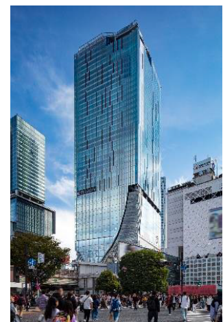
▲渋谷スクランブルスクエア外観

名称： 渋谷スクランブルスクエア／SHIBUYA SCRAMBLE SQUARE 事業主体： 東急(株)、東日本旅客鉄道(株)、東京地下鉄(株) 所在： 東京都渋谷区渋谷2丁目24番12号 用途： 事務所、店舗、展望施設、駐車場など 延床面積： 第Ⅰ期（東棟）約181,000㎡、第Ⅱ期（中央棟・西棟）約96,000㎡ 階数： 第Ⅰ期（東棟）地上47階地下7階、 第Ⅱ期（中央棟）地上10階地下2階、（西棟）地上13階地下5階 高さ： 第Ⅰ期（東棟）229m、第Ⅱ期（中央棟）約61m、（西棟）約76m 設計者： 渋谷駅周辺整備計画共同企業体 ※(株)日建設計、(株)東急設計コンサルタント、(株)JR東日本建築設計、 メトロ開発(株) デザイン・アキテクト： (株)日建設計、(株)隈研吾建築都市設計事務所、(有)SANAA 事務所 運営会社： 渋谷スクランブルスクエア(株) ※東急(株)、東日本旅客鉄道(株)、東京地下鉄(株)の3社共同出資 開業： 第Ⅰ期（東棟）2019年11月1日 第Ⅱ期（中央棟・西棟）2027年度 URL： https://www.shibuya-scramble-square.com